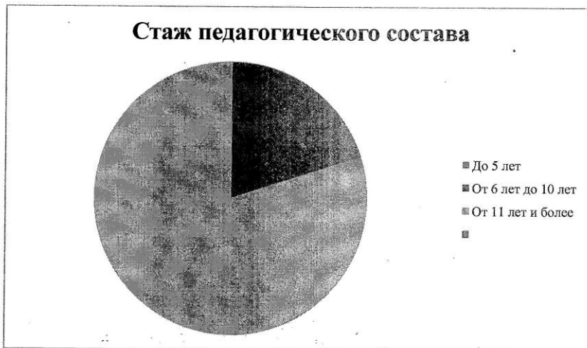
Диаграмма с характеристиками кадрового состава Детского сада по стажу

Педагоги постоянно повышают свой профессиональный уровень, эффективно участвуют в работе методических объединений, знакомятся с опытом работы своих коллег и других дошкольных учреждений, а также саморазвиваются. Все это в комплексе дает хороший результат в организации педагогической деятельности и улучшении качества образования и воспитания дошкольников.