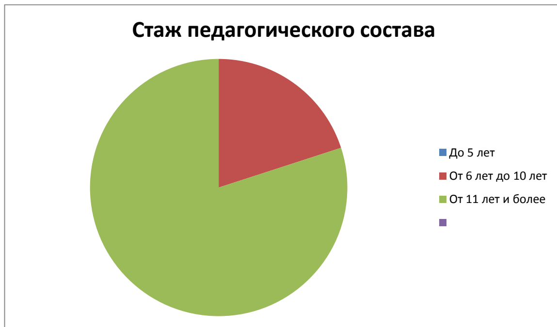
Диаграмма с характеристиками кадрового состава Детского сада по стажу

Педагоги постоянно повышают свой профессиональный уровень, эффективно участвуют в работе методических объединений, знакомятся с опытом работы своих коллег и других дошкольных учреждений, а также саморазвиваются. Все это в комплексе дает хороший результат в организации педагогической деятельности и улучшении качества образования и воспитания дошкольников.